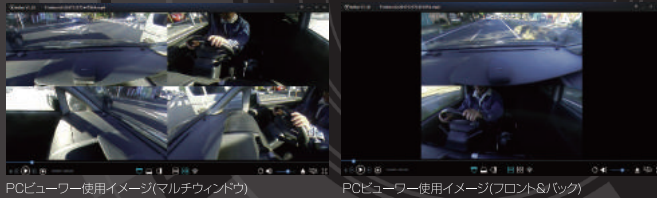
PCビューワー使用イメージ(マルチウィンドウ)

専用のPCビューワー(アプリケーション)を使用すると、録画した映像を様々なアングルで表示再生ができます。