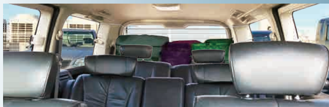
ルームミラーからの景色

純正ルームミラーに比べ画角が広いので、車両後方の映像を広範囲で表示できます。リアシートや車室内が映りこまず、後方がしっかりと見えて安全・安心のドライブが可能です。